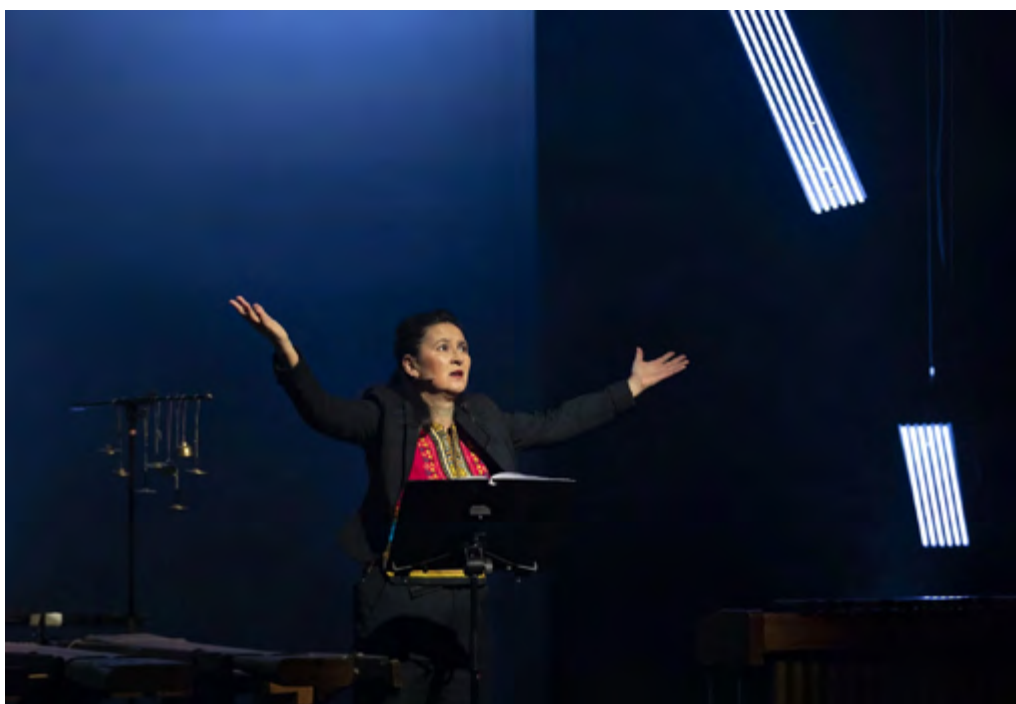
Stille Nacht am Silbersee / Mi Sa Memre Yu / foto Anne van Zantwijk

Door deze organisatorische transitie waren we gedwongen voorgenomen producties te verplaatsen. Zowel Requiem voor de Onwerkelijkheid als Deadly Poodles werden verplaatst naar 2025. De culturele sector kampt met een gebrek aan personeel, ook voor Silbersee was dat in 2023 realiteit. Om de juiste artiesten, producenten en technici (ook in de toekomst) aan ons te kunnen verbinden, hebben wij dieper in de buidel moeten tasten. Daar kwamen door de inflatie prijsstijgingen van grondstoffen bovenop. Deze werkten tevens door in de budgettering van de materiele lasten van producties (bijvoorbeeld decor, transport).