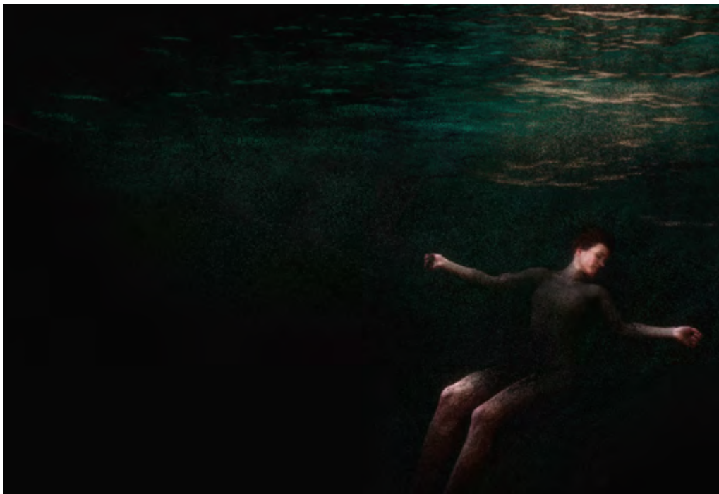
Eurydice