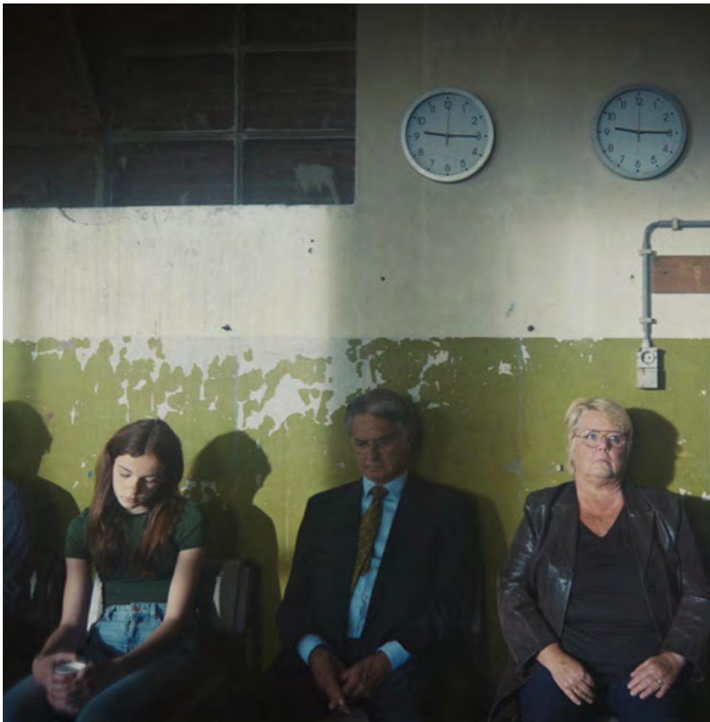
MAD