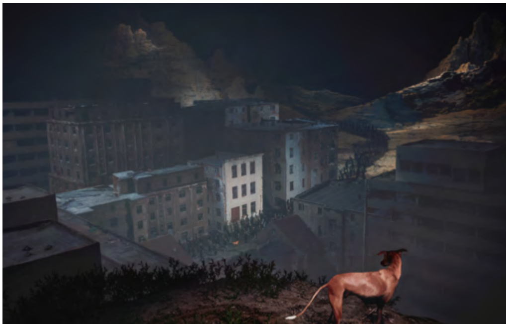
Songs for a passerby

Er was in 2023 veel media-aandacht voor de producties van Silbersee. Nadat de VR-opera Songs for a Passerby in première ging tijdens de Biënnale van Venetië en daar de Grand Prize won, verschenen er talrijke artikelen en recensies in dagbladen als de Volkskrant, Parool en NRC, en media als de Groene Amsterdammer en de Filmkrant. Verder verschenen er recensies voor Mother's White en UMVA! . Al deze aandacht heeft op positieve wijze bijgedragen aan de naamsbekendheid van de organisatie.