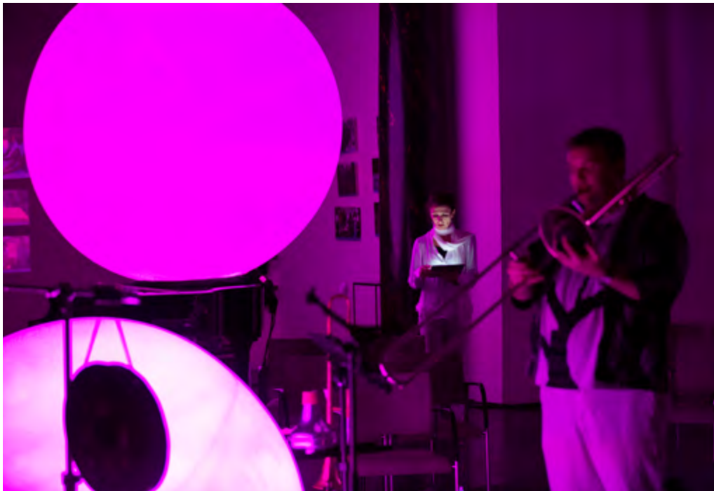
Harmony of the spheres