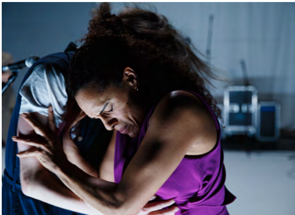
Mother's white

Mother's White is een dans- en muziektheaterproductie voor kinderen (12+) en hun ouders/begeleiders. De voorstelling laat de relatie zien tussen een witte moeder en een zwart kind. De compositieopdracht verstrekten we aan componist/performer Akim Moiseenkov, die de kunst verstaat om met zelfgemaakte instrumenten en objets trouvés een wonderlijke klankwereld te creëren. Het libretto werd geschreven door Sjaan Flikweert, die als spoken word artiest veel ervaring heeft met het vertalen van persoonlijke verhalen in een poëtisch-muzikaal idioom. Zij schreef het libretto op basis van gesprekken met moeders en kinderen die deze situatie leven of geleefd hebben.